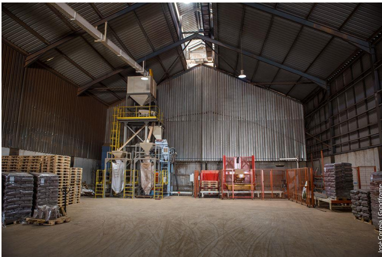
Introdução de mais um produto – pellets industrial e doméstico ensacado