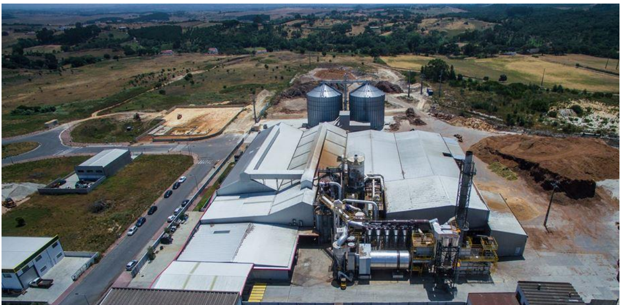
Vista panorâmica da fábrica